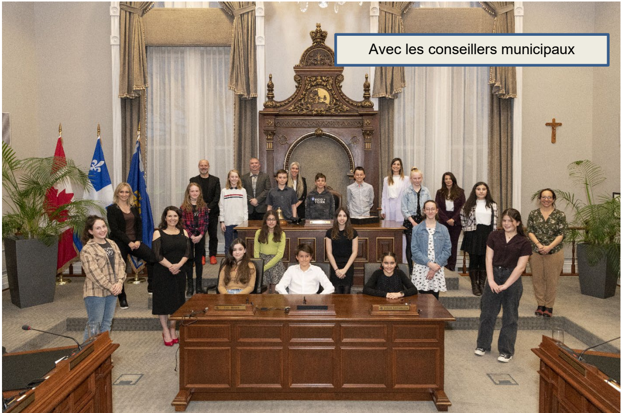
Avec les conseillers municipaux